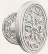
No. NQ267 y NQ424