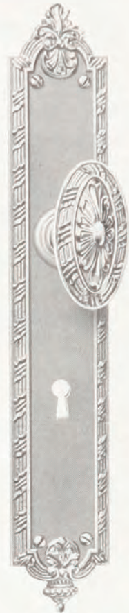
Nos. SD290 y SD267

Estas piezas son apropiadas únicamente para las siguientes cerraduras con entradas estrechas y cerrojos de dos vueltas: Nos. 689 1/4 G, 752 1/4 G, 755 1/4 G, 787 1/4 G, 788 1/4 G, 789 1/4 G, B854 G, 1510 G, 1526 G, y puede suministrarse en vez de la guarnición sencilla "GT" en las páginas 24-30.