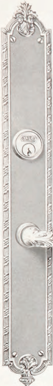
Nos. SD294 y SD935