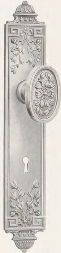
Nos. NQ290 y NQ267