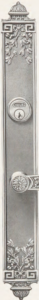
Nos. NQ293 y NQ942

Véase Lista Descriptiva de Acabados, Página 7